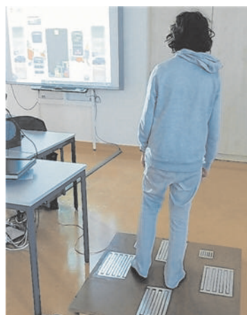
▲ Die Schüler der Mittelschule Frauenfeld bauten sich eine eigene Steuerungskonsole, um etwa Tetris zu spielen.

Informatik, Werken und Physik eine Steuerungsplatte, mit der etwa Tetris oder Mario Kart gespielt werden kann. „Die Steuerung wurde mit klassischen Pfeiltasten sowie Leertaste und